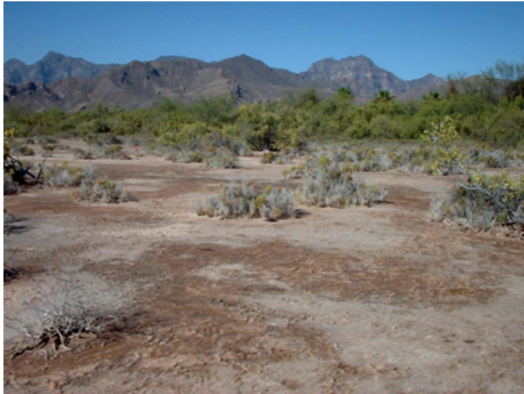
Paisaje Zona Costera