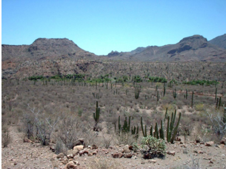
Paisaje Oasis Primer Agua