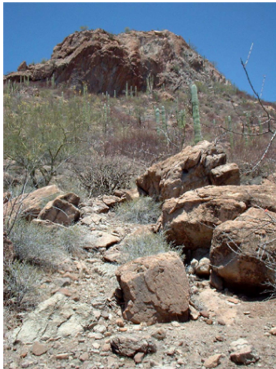
Paisaje Sierra Giganta