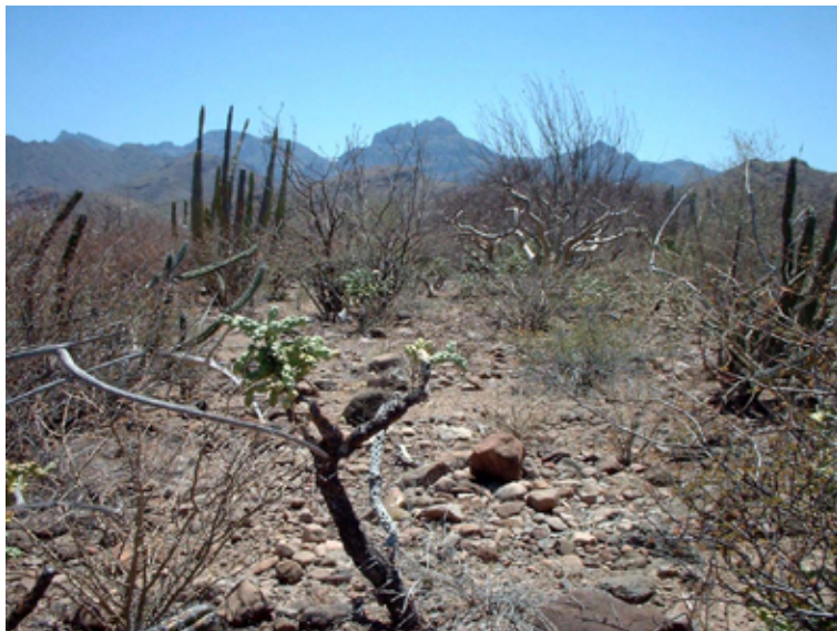
Paisaje Estribaciones Sierra Giganta